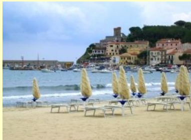
MARINA DI CAMPO

Marina Di Campo - to ponoć pierwsze kąpielisko na wyspie, największy ośrodek wypoczynkowy, duża plaża z białym piaskiem, bogate życie nocne. Warto tu zakotwiczyć na kilka godzin. Nieco dalej na wschód znajduje się mała miejscowość Campo Nell'Elba - w niej zacumujemy na nieco dłużej.