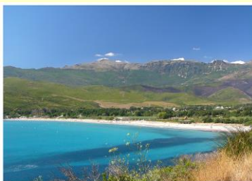
MARINA DI PIETROCARBONARA

Marina di Pietracarbonara- jedna z wielu bezkresnych plaż przy której warto zakotwiczyć w drodze do Bastii. Rozdzieli nam ona dwa etapy- kąpiel będzie uzasadniona. Podczas dalszej żeglugi miniemy malutki porcik Miomo.